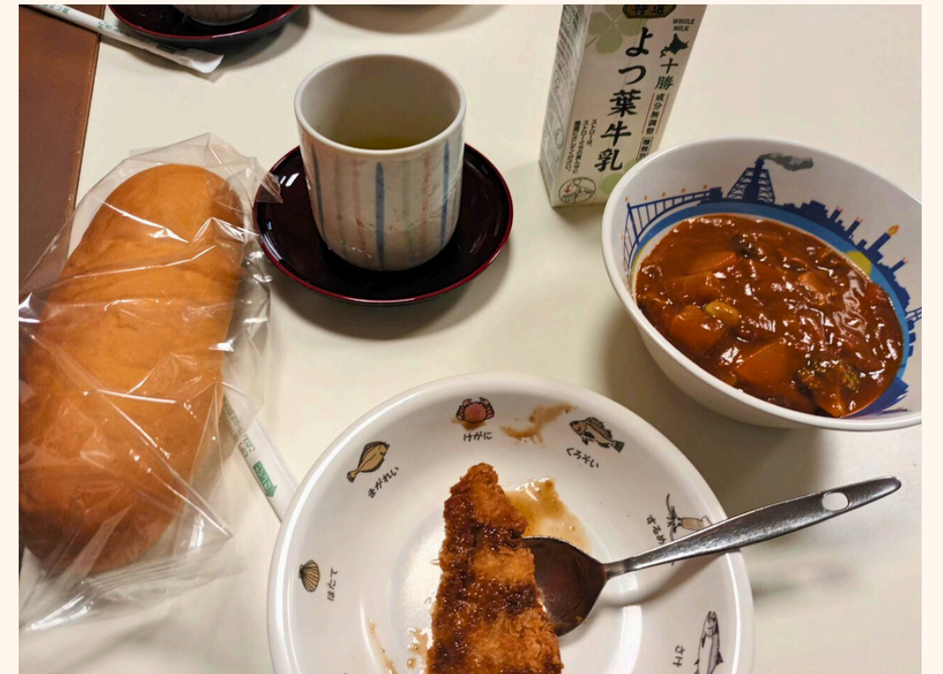
幸運吃到的小學午餐