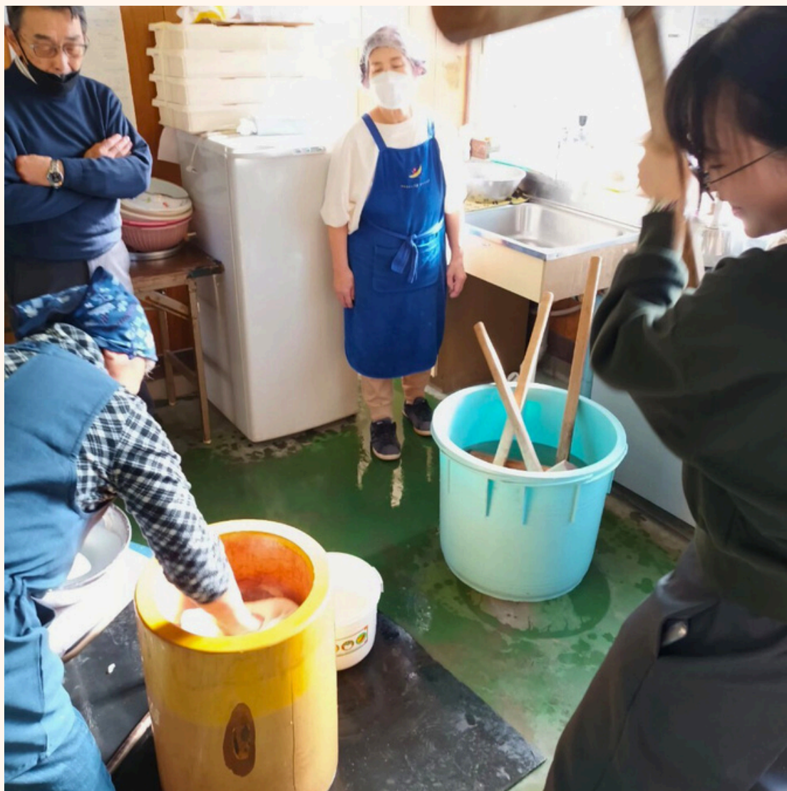
去高砂町會館體驗餅つき大会 (當地的台灣人特別稀有，所以有上當地報紙)